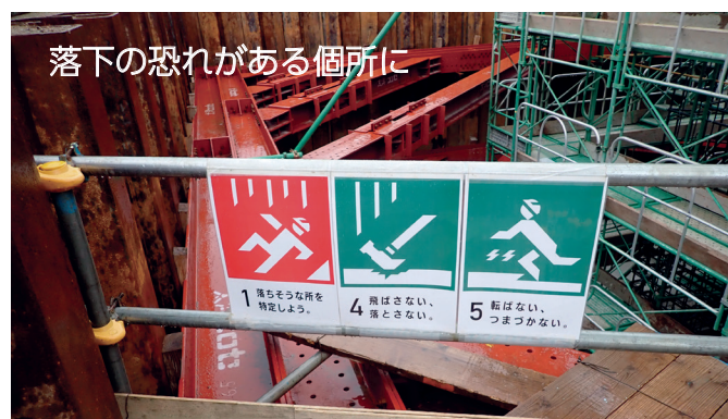
落下の恐れがある個所に