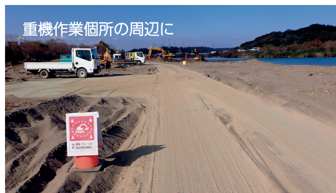
重機作業個所の周辺に