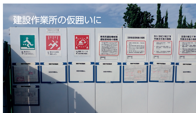
建設作業所の仮囲いに